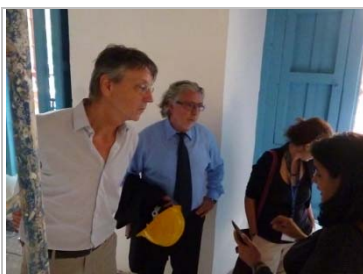
OHCH explicando las salas y su uso

El mes de mayo 2014 ha sido decisivo para el proyecto Rescate Patrimonial y Desarrollo Cultural en La Habana: Palacio del Segundo Cabo : a 53 meses de iniciado se han tomado nuevas decisiones. Ya el 9 de abril, al final de una visita realizada por los altos representantes de la UNESCO y de la Delegación de la Unión Europea (DUE) en Cuba, se valoraron los avances de las obras y el ritmo de ejecución e intensidad de numerosos obreros: La DUE y UNESCO analizaron con la Oficina del Historiador de la Ciudad de La Habana (OHCH) al final de ese encuentro la conveniencia de una nueva visita en mayo para decidir acciones antes de la fecha de cierre acordada para 30 de junio 2014. Se acordó además la posible convocatoria en mayo, para una 4 ta sesión del Comité Gestor para decidir sobre la forma y modo de concluir el proyecto.